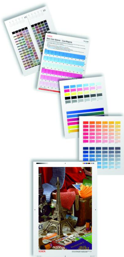
Gli strumenti integrati di calibrazione del colore offrono esattamente i risultati desiderati.