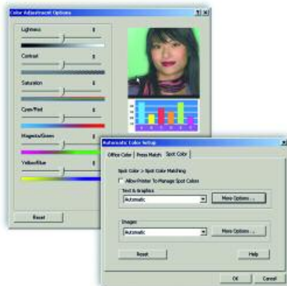
Gli strumenti avanzati di gestione del colore permettono di adattare l'output alle vostre specifiche esigenze.